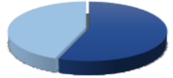
■ Hisse Senedi Uzun ■ Nakit