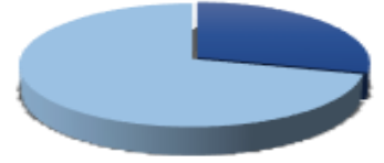
■ Hisse Senedi Uzun ■ Nakit