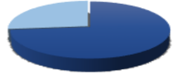
■ Hisse Senedi Uzun ■ Nakit